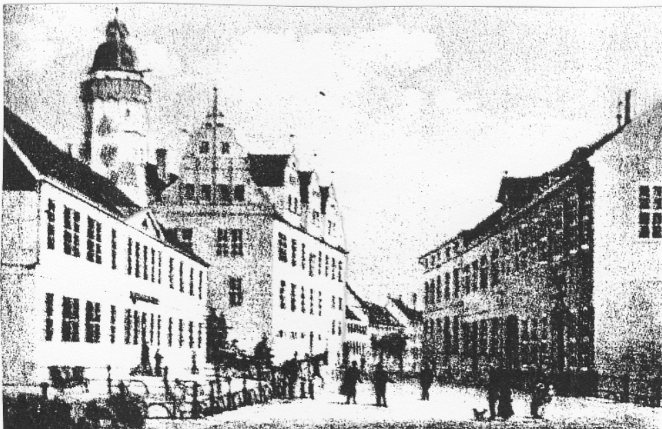
Neuperverstrasse – Blick auf Neustädter Rathaus

An den Turm, um welchen oben eine Galerie umherläuft, schließt sich der Ratskeller an, der ebenfalls verpachtet und ehemals zum Weinschenken berechtigt war“.