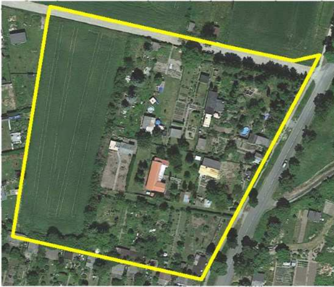
Luftbild des Plangebietes (Stand 2019)

DOP10/2019@LvermGeoLSA Az.: 2020/G01-5008524-2014